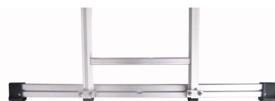
Stigefot Universal (18-4010)